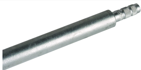
Fotografía no vinculante