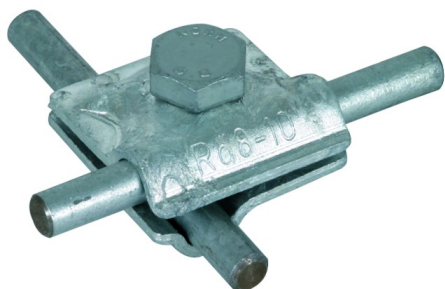
Fotografía no vinculante