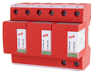
Fotografía no vinculante