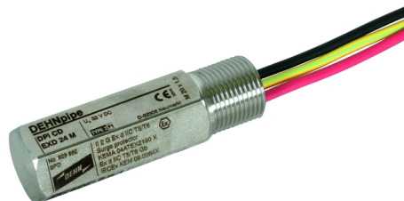
Fotografía no vinculante